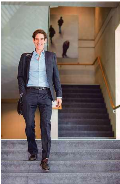
Der Abend mit Landrat Mario Glaser steht unter dem Titel „Wo steht die Region Oberschwaben bei der Energiewende?“.