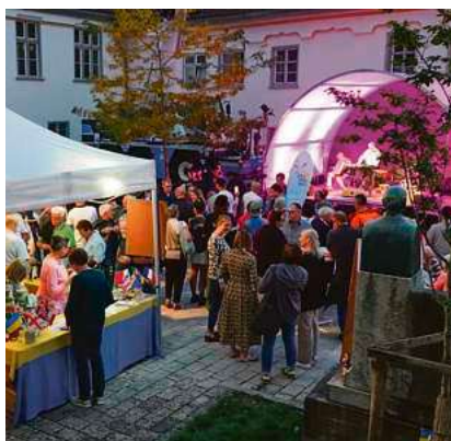
Der Interkulturelle Markt fand 2025 im Spitalhof statt.

In seinem Bericht informiert der an die vhs angebundene städtische Integrationsbeauftragte einmal im Jahr über die Integrationsarbeit in Biberach sowie die damit verbundenen Aufgaben und Themenfelder. Eines davon war Anfang 2025 die Eröffnung des „Lerntreffs im Quartier“ in der Begegnungsstätte „Ubuntu“. Ein vom Bundesministerium für Bildung und Forschung gefördertes Projekt, das an insgesamt 33 vhs-Standorten mit dem Ziel umgesetzt wurde, Menschen mit Alphabetisierungs- und Grundbildungsbedarf zu stärken. Rund 15 Personen besuchten die in vier Schwerpunkte aufgeteilten Angebote jeden Monat. Die Schwerpunkte „Lesen und Schreiben“ und „Digitale Welt“ wurden auch nach der Projektphase weitergeführt. Letzterer ist über Fördermittel längerfristig gesichert. Seit September nutzt die vhs die Räume im Erdgeschoss des ehemaligen „Hotel zur Riss“. Aktuell findet dort viermal in der Woche ein Integrationskurs statt, außerdem einmal wöchentlich ein Digitalkurs. Auch ein Kochkurs wird mehrmals pro Semester angeboten. Laut Poßbeckert ist in den nächsten Wochen und Monaten eine deutliche Ausweitung der Angebote geplant, sowohl im sprachlichen als auch im künstlerischen