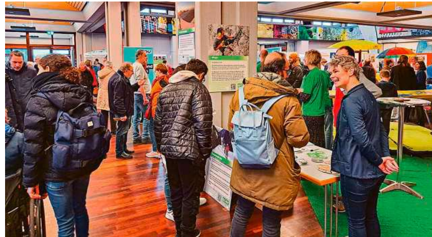
Die Ehrenamtsmesse ist eine Chance, Kontakte zu knüpfen und sich zu vernetzen.