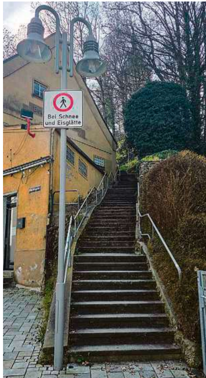
Die Biberstäftele verbinden Altstadt und Gigelberg. Noch in diesem Jahr wird die Treppenanlage saniert.

Die beiden Angebote belaufen sich in Summe auf 160.000 Euro, die Kostenberechnung war von 120.000 Euro ausgegangen. Stadtplanungsamtsleiter Roman Adler berichtete im Bauausschuss, dass die Kostenüberschreitung auf die schwierige Baustelleneinrichtung zurückzuführen sei. Dies hätten die Firmen auf Nachfrage erklärt. Es sei sehr viel Handarbeit mit entsprechendem Personalaufwand notwendig. Ausgeführt werden sollen die Arbeiten