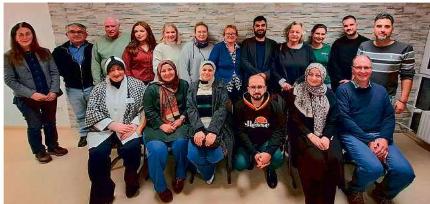
Das „Interkulturelle Forum“ wurde neu gegründet – als offenes Netzwerk von Menschen und Organisationen, die sich für ein weltoffenes, vielfältiges und solidarisches Biberach einsetzen.