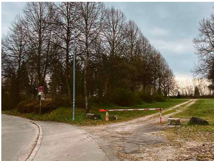
Der Parkplatz Jahnstraße dient im April als zusätzliche, kostenfreie Parkfläche rund um den Gigelberg.

Wer Besorgungen in der Innenstadt zu erledigen hat, kann währenddessen dennoch kostenlosen Parkraum rund um den Gigelberg nutzen: Zum einen wird der Parkplatz Jahnstraße geöffnet, ertüchtigt und besser ausgeschildert. Zum anderen wird von Donnerstag, 16., bis Sonntag, 19. April, der Fahrradstreifen an der Gaisentalstraße zur Parkfläche umfunktioniert. Da Radfahrer solange auf die Fahrbahn ausweichen müssen, wird dort Tempo 30 angeordnet.