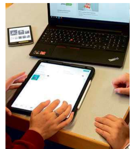
Medienexperten der Stadtbücherei geben Hilfestellung am eigenen Gerät.

Im 30-minütigen Einzelgespräch werden Fragen und Anliegen zu den digitalen Angeboten der Stadtbücherei beantwortet und konkrete Lösungen für individuelle Probleme gefunden. Die Medienexperten zeigen am eigenen mobilen Gerät, wie E-Books aus der Online-Bibliothek heruntergeladen werden können, wie ein E-Book-Reader bedient wird und unterstützen auch bei allgemeinen Fragen zu Tablets und Smartphones. Für Kunden mit gültigem Büchereiausweis ist das Angebot kostenfrei. Nichtkunden zahlen