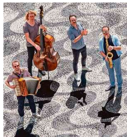
Quadro Nuevo

Mit ihrem neuen Album „Happy Deluxe“ eröffnet die mehrfach ausgezeichnete Band „Quadro Nuevo“ mit ihrer Mischung aus Jazz, Chanson, Latin und Weltmusik die Konzertreihe in der ehrwürdigen Schützenkellerhalle. Das Konzert findet am Donnerstag, 16. April, um 20 Uhr statt.