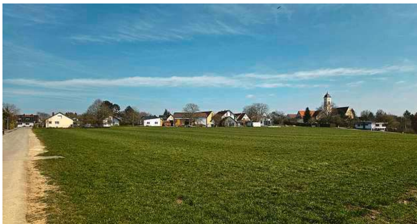
Auf dieser Fläche am nordwestlichen Ortsrand soll das neue Mettenberger Baugebiet entstehen.

Die Stadt Biberach plant im Teilort Mettenberg ein neues Baugebiet. Am nordwestlichen Ortsrand soll auf einer Fläche von 2,1 Hektar Platz für rund 50 Wohneinheiten entstehen. Das Stadtplanungsamt hat für das Wohngebiet „Mettenberger Äcker“ erste Planungsziele definiert und diese im Bauausschuss vorgestellt. Im Investitionsprogramm ist die Erschließung des Baugebiets für das Jahr 2029 vorgesehen.