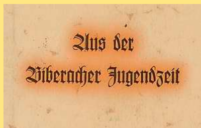
Titelseite des Buches „Aus der Biberacher Jugendzeit“, 1939, Adolf Renz

Wenn sie des Morgens um halb acht mit ihrem „Krättle“ am Arm erschien, in dem ihr Nähhandwerkszeug sich befand, und nach Einnahme ihres Morgenkaffees eine Zeitlang auf ihrem Rohrstuhl dicht am Ofen und nahe am Fenster saß, wobei mehr gemütlich langsam als hastig flugs die Nadel durch ihre mageren Finger glitt, dann verbreitete sich alsbald jener spezifische Geruch, der in allen Schneiderwerkstätten heimisch zu sein pflegt und für den es eine Definition nicht gibt.