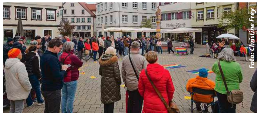
Die Mahnwache findet unter dem Motto „Lass den Frieden auferstehen“ statt.

Bei Regen findet die Veranstaltung im Gemeindezentrum St. Martin, Kirchplatz 3-4, statt. Der Eintritt ist frei, Spenden sind willkommen. Bei Fragen kann man sich per E-Mail an info@friedensbuendnis-bc.de wenden oder die Webseite www.friedensbuendnis-bc.de besuchen.