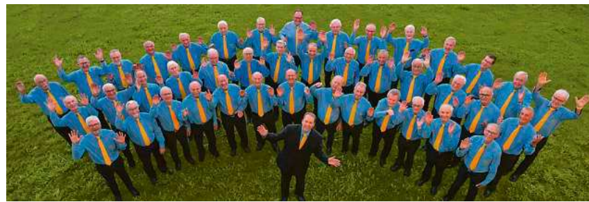
Der Männerchor „Frohsinn“ freut sich, wieder einmal in der Gigelberghalle singen zu dürfen.

Der Männerchor „Frohsinn“ lädt am Samstag, 2. Mai, 19.30 Uhr, zum Frühjahrskonzert in die Gigelberghalle ein. Der Vorverkauf läuft bereits.