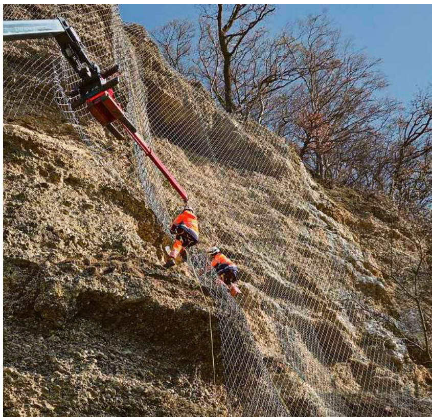
Ein großes Stahlnetz sichert die Nagelfluhwand in der Ulmer Straße. Arbeiter verbinden die einzelnen Netzrollen in luftiger Höhe.