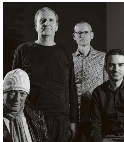
„NuMoksha“