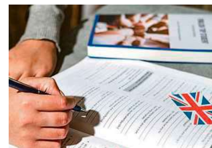
In den Englischkursen gibt es noch freie Plätze.

Mit dem Start des neuen Semesters beginnen an der vhs mehrere Englischkurse, in denen noch freie Plätze verfügbar sind. Das Angebot berücksichtigt unterschiedliche Sprachniveaus und Lernziele – vom Auffrischen der Grundlagen bis hin zur anspruchsvollen Konversation und Literaturarbeit.