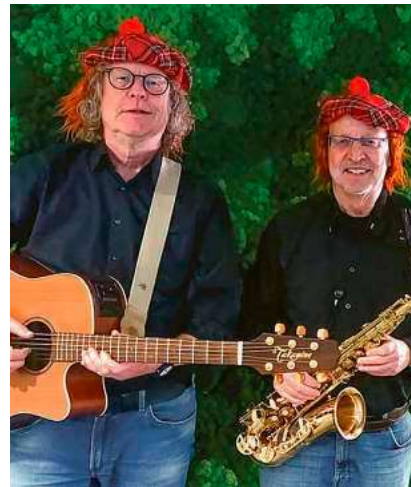
Die Brüder Gratz garantieren gute Stimmung mit einem abwechslungsreichen Musikprogramm.

Dem Anlass entsprechend dürfen die Gäste kostümiert kommen. Das beste Kostüm wird prämiert. Der Eintritt ist frei.