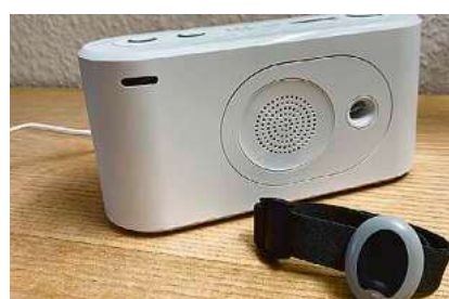
Der Hausnotruf bietet Sicherheit und schnelle Hilfe im Notfall.

Weitere Informationen zur Reihe finden sich unter www.vhs-bw.de/projekte/gesund-und-digital-vorort/#webinar-reihe . Die Teilnahme ist kostenfrei. Eine Anmeldung ist jedoch erwünscht.