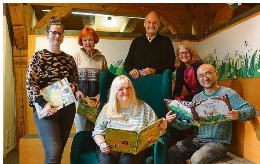
Das Theatrino der Stadtbücherei wird zum Geschichtenraum.

Der Büchereiausweis für Kinder und Jugendliche unter 18 Jahren ist kostenfrei erhältlich. Die Stadtbücherei hat Dienstag bis Freitag von 10 bis 19 Uhr und Samstag von 10 bis 14 Uhr geöffnet.