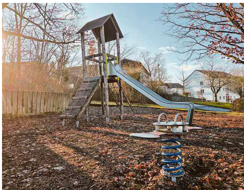
Der Spielplatz Köhlesrain wird in diesem Jahr neugestaltet und soll ein Spielangebot für alle Altersgruppen bieten.

Auf dem Spielplatz Neusatzweg sollen gemäß der beschlossenen Spielleitplanung alle Spielgeräte entfernt und die bisherige Sandspielfläche in eine artenreiche Blumenwiese umgewandelt werden. Die Rasenfläche soll erhalten und mit Bäumen ergänzt werden. Die Planung für den Rückbau wird derzeit erstellt. Angestrebt wird eine „einfache und pflegearme Gestaltung“. In der Sitzungsvorlage wird allerdings auch darauf hingewiesen, dass der Verein „Jugend Aktiv“ sowie Mitglieder des Stadtteilvereins „Weißes Bild“ den Rückbau dieses Spielplatzes kritisch sehen. Beim Spielplatz Klauflügelweg sieht die Verwaltung den wöchentlichen