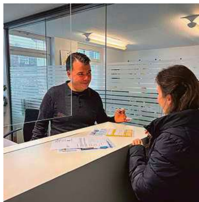
Für persönliche Beratungen bei der e.wa riss muss im Vorfeld ein Termin über die Website des Versorgers gebucht werden.

Mit Blick auf den Versand der Jahresabrechnungen und das damit erfahrungsgemäß steigende Beratungsaufkommen erinnert die e.wa riss an ihr neues Servicekonzept: Persönliche Anliegen im Servicebüro sind nur noch mit vorher gebuchtem Termin möglich. Dies ist besonders wichtig, da in den kommenden Wochen ein erhöhtes Kundenaufkommen aufgrund vieler Rückfragen zu den Rechnungen zu erwarten ist. Durch die Terminvergabe stellt die e.wa riss sicher, dass jede Kundin und jeder Kunde ein verbindliches Zeitfenster erhält und sich die Mitarbeitenden optimal auf die Beratungen vorbereiten können.