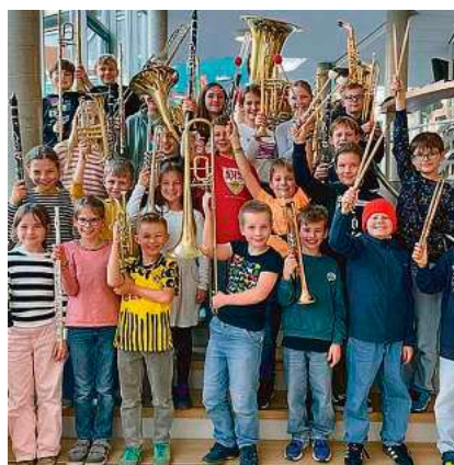
Die Bruno-Frey-Musikschule lädt am 11. Februar zu närrischer und beschwingter Musik ein.