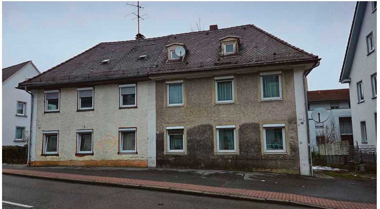
Am Bismarckring sollen neue Wohnungen entstehen. Die rechte Gebäudehälfte (Hausnummer 23) soll dafür abgerissen werden.