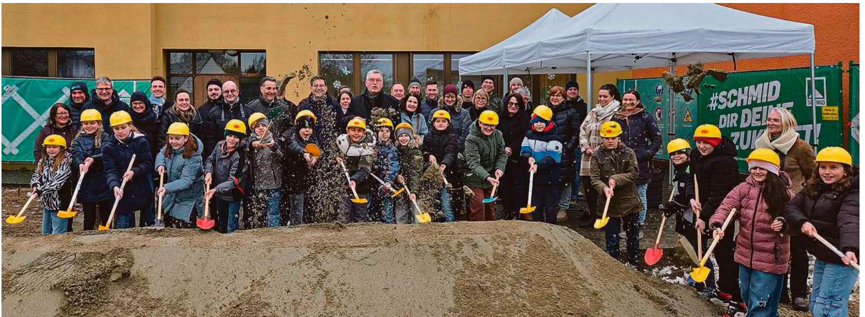
Spatenstich mit Viertklässlern: Der Anbau der Gaisental-Grundschule soll im September 2027 fertig sein.