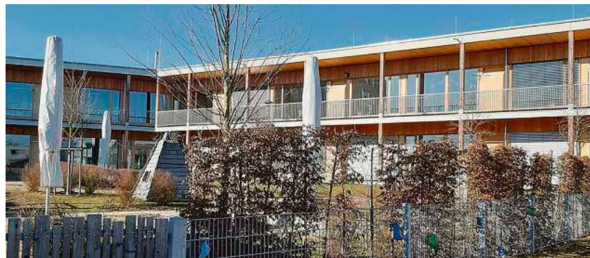
Im Kindergarten Hauderboschen in der Schweidnitzallee 1 wurde ein neues Wahllokal eingerichtet.

Was Rumpelstilzchen bei seinem Tanz ums Feuer kichernd verriet, war vor ei-