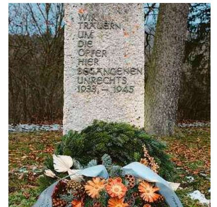
Ein Gedenkstein bei Zwiefalten erinnert an die Opfer der nationalsozialistischen Euthanasie.

eigenen Familie zu forschen und die Ergebnisse im Gedenkbuch zu veröffentlichen. Über die E-Mail-Adresse digitales-gedenkbuch@gfh-biberach.de kann Kontakt zur Forschergruppe aufgenommen werden.