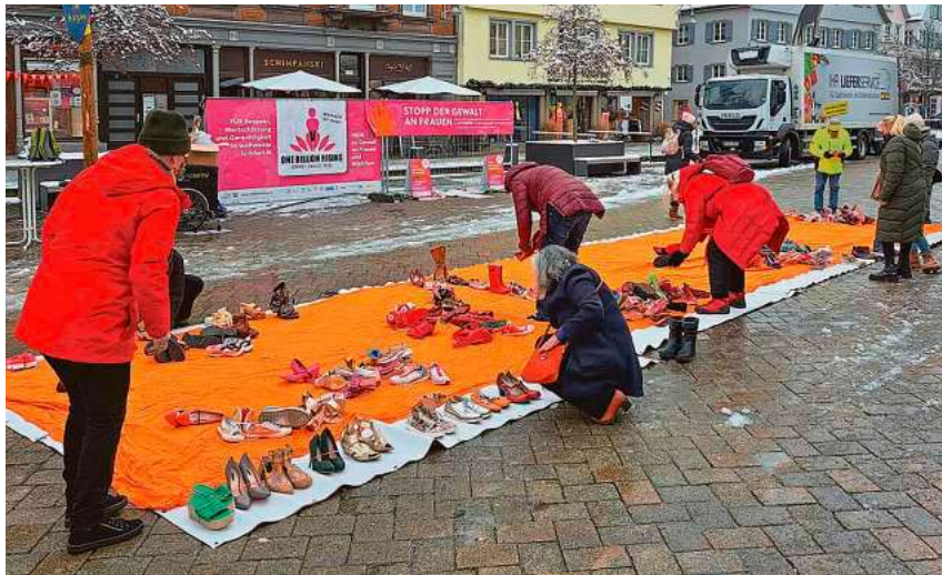
Die Biberacher Agendagruppe ruft am 14. Februar zum Aktionstag „One Billion Rising“ auf. Dieses Jahr finden Tanzdemo und Schuhaktion auf dem Kirchplatz statt.