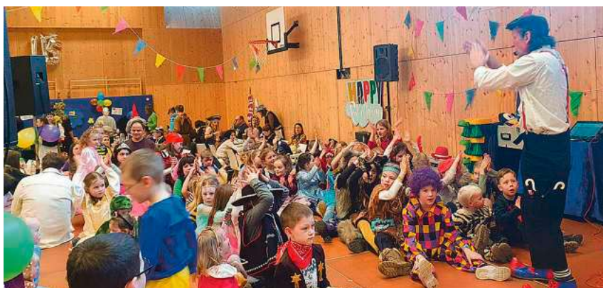
Spiel und Spaß für Kinder gibt es bei der diesjährigen Kinderfasnet in der Mettenberger Turn- und Festhalle.

Die Jugendkapelle des Musikvereins Mettenberg veranstaltet am Sonntag, 8. Februar, ab 13.58 Uhr in der Turn- und Festhalle Mettenberg ihre traditionelle Kinderfasnet.