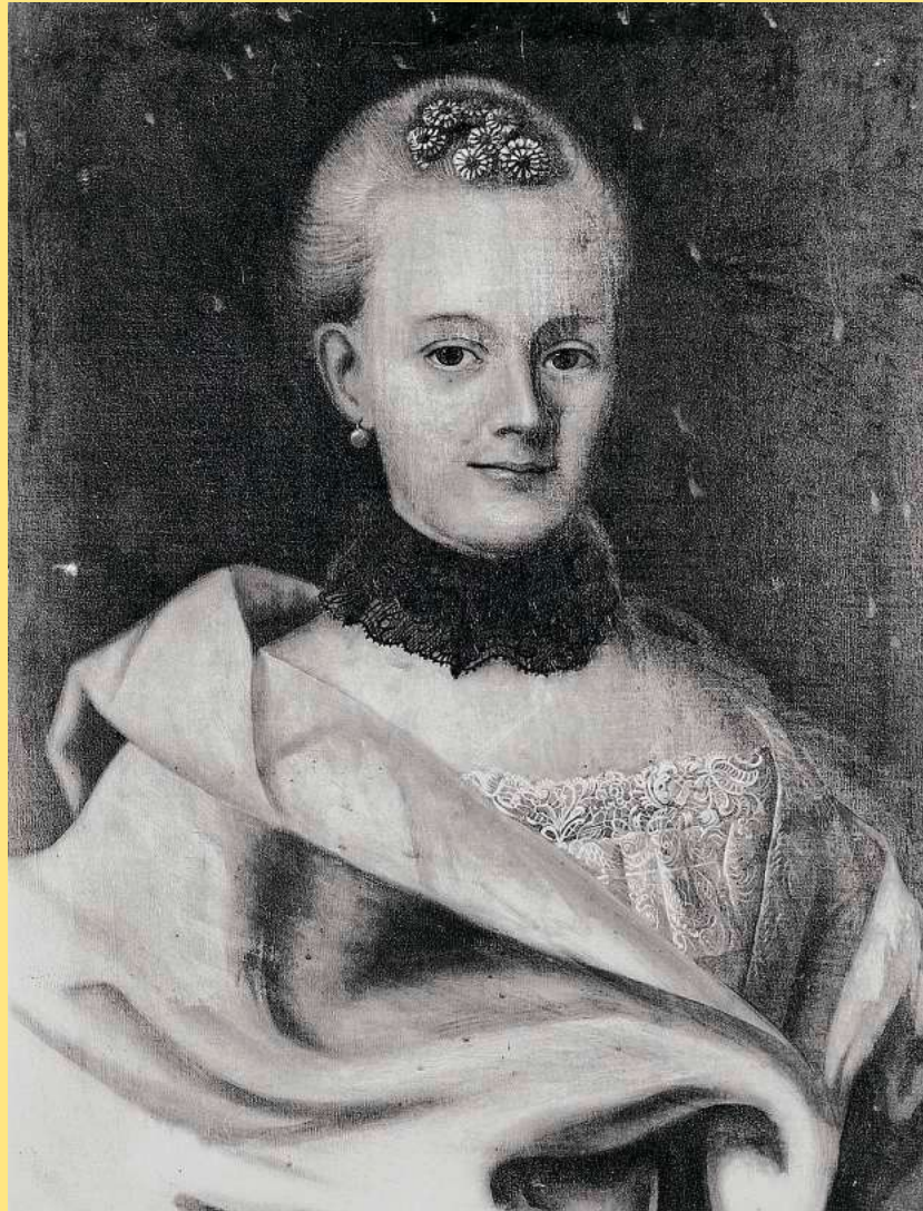
Sophie von La Roche (Reproduktion)