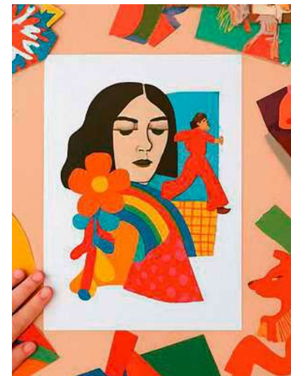
In der Kinderwerkstatt können am 14. Februar bunte Collagen zum Thema „Flower-Power“ gestaltet werden.

Die Teilnahme kostet pro Kind 5 Euro, eine vorherige Anmeldung ist erforderlich. Bei der Anmeldung sollten Namen und Alter des Kindes sowie eine Notfalltelefonnummer angegeben werden. Die Anzahl der Plätze ist begrenzt. Anmeldungen erfolgen per E-Mail an museum@biberach-riss.de oder telefonisch unter 07351/51-331.