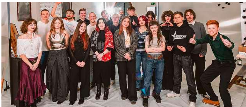
Die diesjährigen Absolventinnen und Absolventen im Grafikdesign freuen sich auf die Ausstellung ihrer Diplomarbeiten.

Informationen zur Ausbildung Grafikdesign gibt es bei einer Infoveranstaltung am Dienstag, 24. Februar, 17.30 Uhr. Schnupperpraktika am Donnerstag, 12. März, oder Dienstag, 12. Mai, bieten einen Einblick in die gestalterische Medienwelt. Für Schulklassen gibt es direkt nach den Faschingsferien Schnupperprojekte. Weitere Informationen unter www.hauchler.de .