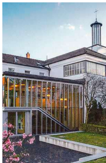
Das Begegnungsvesper findet in der EFG, Ecke Maliweg/Schönfeldstraße, statt.