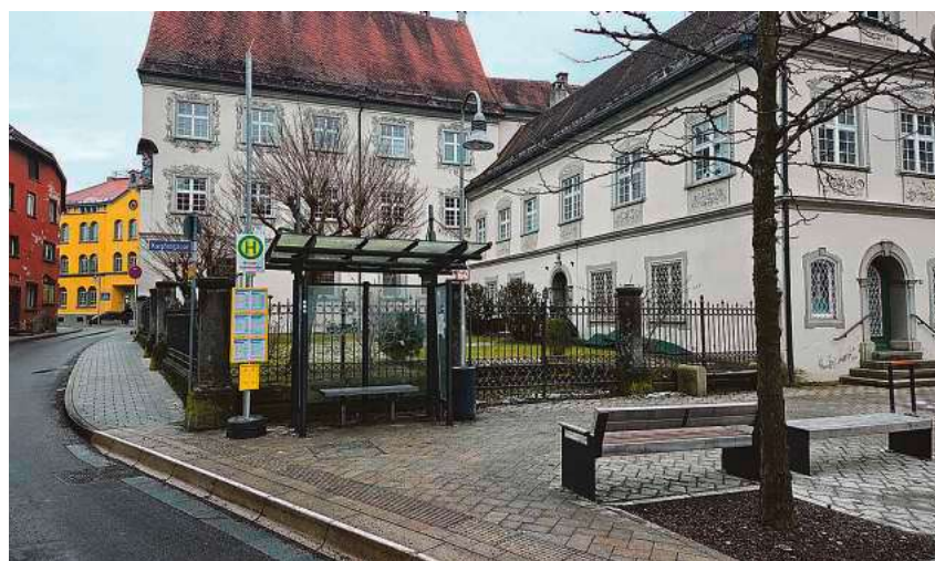
Bei den Haushaltsberatungen im Bauausschuss wurde viel diskutiert. Unter anderem über die Zukunft des Pestalozzihauses und die Erweiterung der Bushaltestelle am Holzmarkt.