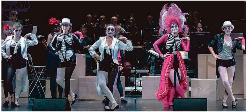
Ein neuer „Modern & Jazz Dance“-Kurs für die Juks-Zirkusproduktion „Dreams“ startet ab Februar.

Ein neuer „Modern & Jazz Dance“-Kurs für Jugendliche von zwölf bis 16 Jahren startet ab Donnerstag, 5. Februar, von 18 bis 19 Uhr in der Jugendkunstschule (Juks). Unter Leitung von Celina Scheuerl verschmelzen moderne Musik, ausdrucksstarke Choreografien sowie fließende und kraftvolle Bewegungen zu einem energiegeladenen Tanztraining.