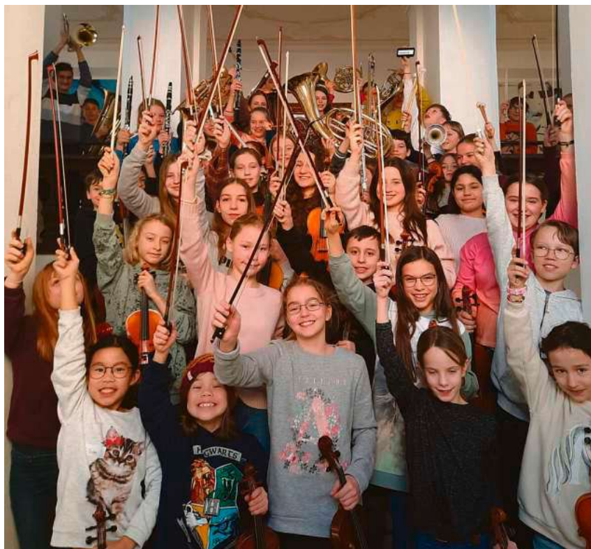
Die Bruno-Frey-Musikschule führt junge Menschen zusammen, um gemeinsam zu musizieren.

Viele fragen sich, ob Kinder mit Ganztagschule und Nachmittagsunter-