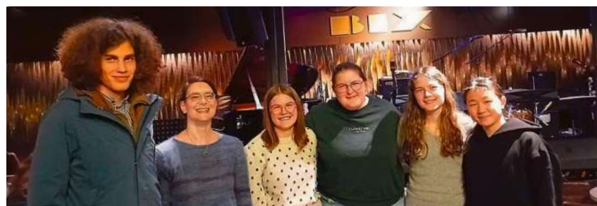
Der Musik-Leistungskurs nach dem Jazzkonzert mit der „Band in the Bix“ im gleichnamigen Stuttgarter Jazzclub.

Auch in diesem Jahr wird die Tradition, dass der Musikleistungskurs des Pestalozzi-Gymnasiums in der Woche vor der fachpraktischen Abiturprüfung als Generalprobe ein öffentliches Konzert gestaltet, weitergeführt.