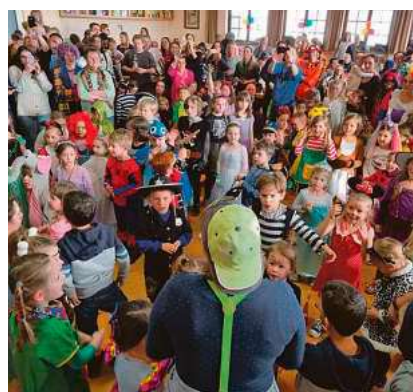
Kleine Prinzessinnen, Cowboys, Indianer und Clowns versammeln sich zur Kinderfasnet.

Die Kinder der Evangelischen Kindertagesstätte Talfeld und des Familienzentrums St. Nikolaus Talfeld haben zur Unterhaltung ein abwechslungsreiches Programm einstudiert. Während Prinzessinnen, Cowboys, Indianer und Clowns um die Wette toben, haben die Erwachsenen Zeit, sich gemütlich mit Kaffee, Kuchen sowie Waffeln und Pommes zu verköstigen. Wie jedes Jahr werden auch wieder viele Spiele angeboten. Bei Tanzspielen, Eier- oder Hammellauf gibt es Preise zu gewinnen. Mit Stimmungsmusik von altbewährt bis modern unterhält