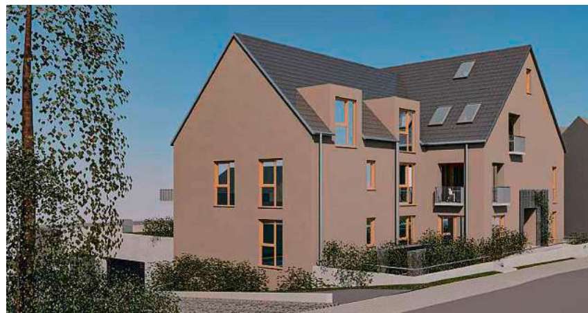
In der Saulgauer Straße soll neuer, innenstadtnaher Wohnraum entstehen. So könnte das Gebäude aussehen. Grafik: Architekten am Weberberg

Der rechtswirksame Ortsbauplan „Wolfental – Süd“ aus dem Jahr 1962 lässt die vom Eigentümer angestrebte Entwicklung in der Saulgauer Straße 54 nicht zu. Stadtplanungsamtsleiter Roman Adler erklärte im Bauausschuss, dass die Verwaltung die Pläne an dieser Stelle unterstütze. Durch Nachverdichtung entstehe neuer Wohnraum, das Wohngebäude mit drei Geschossen sei städtebaulich verträglich. Neues Planungsrecht soll nun über einen Bebauungsplan hergestellt werden, der ausschließlich dieses rund 1.000 Quadratmeter große Grundstück betrifft. Im Bauausschuss wurde bereits der Entwurf des Bebauungsplans