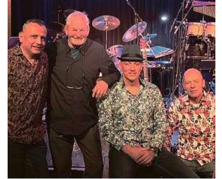
Vogelfrei-FM tritt im Jazzclub auf.