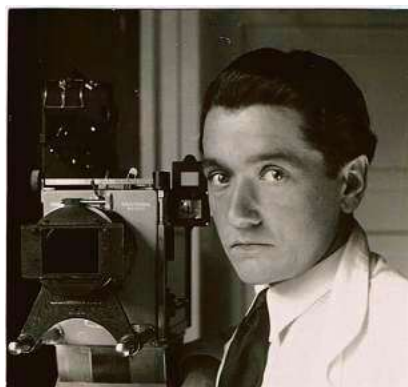
Regisseur Anton Kutter drehte „Die weiße Majestät“ 1933.

Zum Inhalt: In einem auf 3.500 Meter am Fuß des Monte Verita gelegenen Hotel geraten die Gäste in Panik. Das Tauwetter hat Verbauungen beschädigt, die das Hotel vor Lawinen schützen. Jeden Moment kann eine Katastrophe hereinbrechen, wenn niemand die Lawine mit einer Explosion in andere Bahnen lenkt. Keiner der Bergführer vom darunter liegenden Dorf erklärt