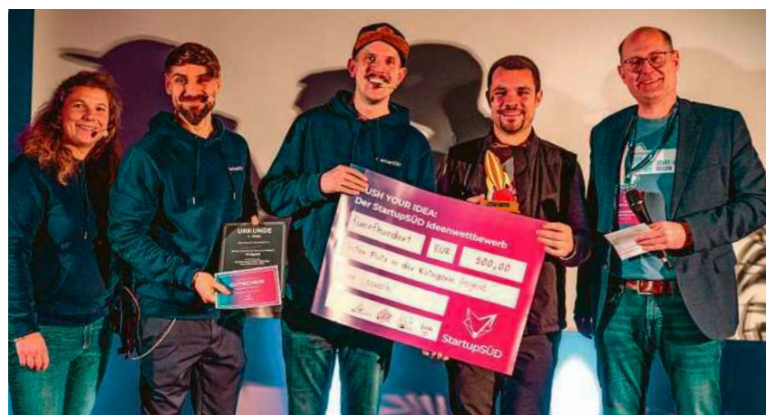
Team Loswerk überzeugte beim Ideenwettbewerb „Push your idea“ und belegte Platz eins in der Kategorie „Freigeist“