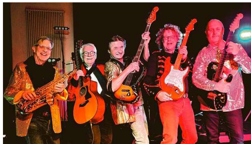
Die „Crazy Allstar Band“ rockt am 31. Januar die Gigelberghalle.