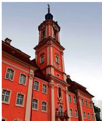
Auf einer Anhöhe mit guter Aussicht liegt die Basilika Birnau.

Auf einem gut ausgebauten Wander- und Radweg geht es am Bodenseeufer entlang nach Überlingen. Dabei wird auch das ein wenig abseits der Hauptwege gelegene Baudenkmal erkundet, die Kapelle St. Cosmas und Damian. Bevor die Regionalzüge nach Biberach zurückkehren, gibt es noch einen Kaffee. Gewandert wird auf einer Strecke von 15 Kilometern, zu überwinden sind bis zu 220 Höhenmeter. Die Teilnahme kostet 18 Euro für Mitglieder und 23 Euro