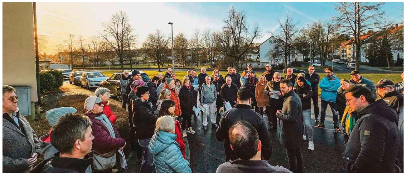
Vor-Ort-Termin auf dem Mittelberg: Zahlreiche Interessierte waren gekommen, um sich über die geplanten Entwicklungen zu informieren.

Die Stadt Biberach will auf dem Mittelberg neuen Wohnraum schaffen. Drei in die Jahre gekommene Mehrfamilienhäuser des Eigenbetriebs Wohnungswirtschaft in der Kepler- und Hölderlinstraße sollen durch Neubauten ersetzt werden. Auch für die angrenzende Freifläche an der Valenceallee ist eine Bebauung geplant. So könnten auf insgesamt rund 7.900 Quadratmetern mehr als 100 Wohneinheiten entstehen. Das Stadtplanungsamt und der Eigenbetrieb Wohnungswirtschaft stellten jetzt bei einem Vor-Ort-Termin die Pläne vor – rund 60 Interessierte waren gekommen.