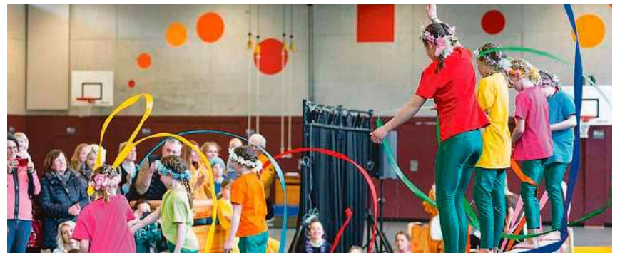
Beim Kissimo-Geburtstag können Kinder Zirkusluft schnuppern und sich austoben.