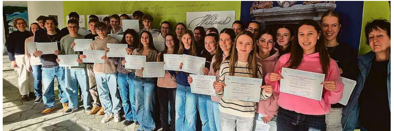
34 Schülerinnen und Schüler des Wieland-Gymnasiums haben das international anerkannte DELF-Zertifikat erworben.