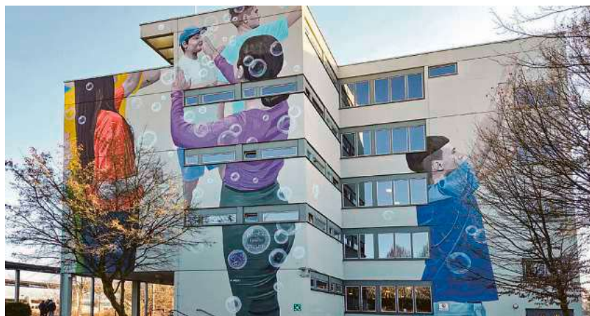
Die Kosten für die Sanierung der Mali-Schule können voraussichtlich über das Investitionsprogramm des Bundes abgedeckt werden – was den städtischen Haushalt entlastet.

53 Millionen Euro für Baumaßnahmen stehen im Haushaltsentwurf 2026, in Summe gar Auszahlungen in Höhe von 74,5 Millionen Euro. Da sich Letztere