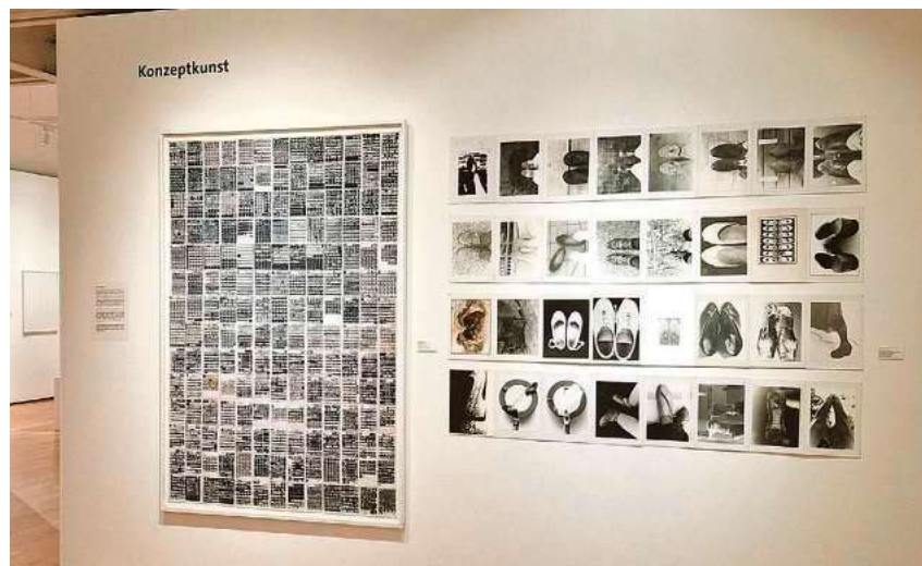
Konzeptkunst „Stationen des Lebens“ von Elisabeth Finck, rechts die Serie „Schuhe“ (Leporello mit 36 Fotos, 1965 bis 1979).

Die Konzeptkunst entstand in den späten 1960er-Jahren und markierte einen grundlegenden Wandel im Verständnis von Kunst. Nicht mehr die ästhetische Ausführung stand im Mittelpunkt, sondern die Idee selbst wurde zum eigentlichen Kunstwerk. Das Konzept rückte in den Vordergrund, während Materialität und handwerkliche Umsetzung bewusst in den Hintergrund traten. In den 1970er-Jahren gewann innerhalb dieses Ansatzes insbesondere für Künstlerinnen die Auseinandersetzung mit der weiblichen Identität an Bedeutung. Vor dem Hintergrund gesellschaftlicher Umbrüche begannen sie, Fragen nach Sozialisation, Rollenbildern und Geschlechterkonventionen kritisch zu untersuchen und diese Themen in konzeptuelle künstlerische Arbeiten zu überführen. Häufig wurden diese Konzepte seriell oder in Variationen entwickelt. Persönliche Gegenstände,