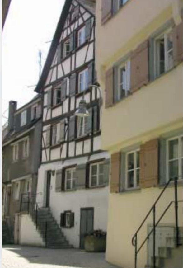
Ehemalige Weberhäuser in der Weberberggasse

Ein Weber, der in betrügerischer Absicht Tuche verändert hatte und seine Schulden