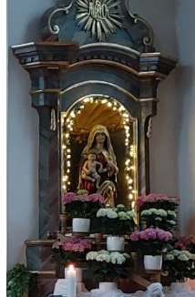
Maialtar in der Kirche in Ringschnait

Am Donnerstag, 22. Mai um 19 Uhr – wir freuen uns auf Sie!