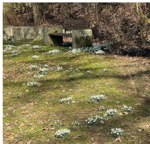
Frühlingsboten auf dem Friedhof in Mettenberg

Wer also Kontakte in die südfranzösische Partnerstadt sucht, seine frankophilen Interessen auffrischen möchte und für die beiden Ehepaare, die beiden „Tandems“ und/oder die vier Einzelpersonen im oben genannten Zeitraum Unterkunft gewähren kann, möchte sich bitte baldmöglichst beim StäPa melden. Kontakt: Karin Grimm, per E-Mail unter info@staepabc.de , oder Montag- und Mittwochnachmittag (jeweils 16 – 18 Uhr) telefonisch unter 01590 1977084. Schon im Voraus herzlichen Dank für die Unterstützung!