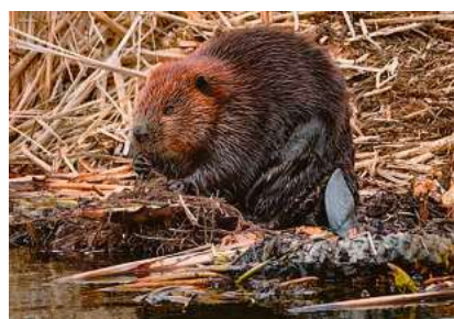
Der Biber ist in Süddeutschland wieder heimisch.

die Teilnehmenden am Samstag, 10. Mai, von 14 bis 16 Uhr. Bei einer Exkursion in ein Biberrevier erfahren sie, wie sich der einst fast ausgestorbene Biber Süddeutschland zurückerobert hat und welche positiven wie auch herausfordernden Folgen dies mit sich bringt. Ein Experte gibt Einblicke in die Lebensweise des streng geschützten Tiers und das landesweite Bibermanagement. Treffpunkt ist der Parkplatz des Dehner Gartencenters in Biberach.