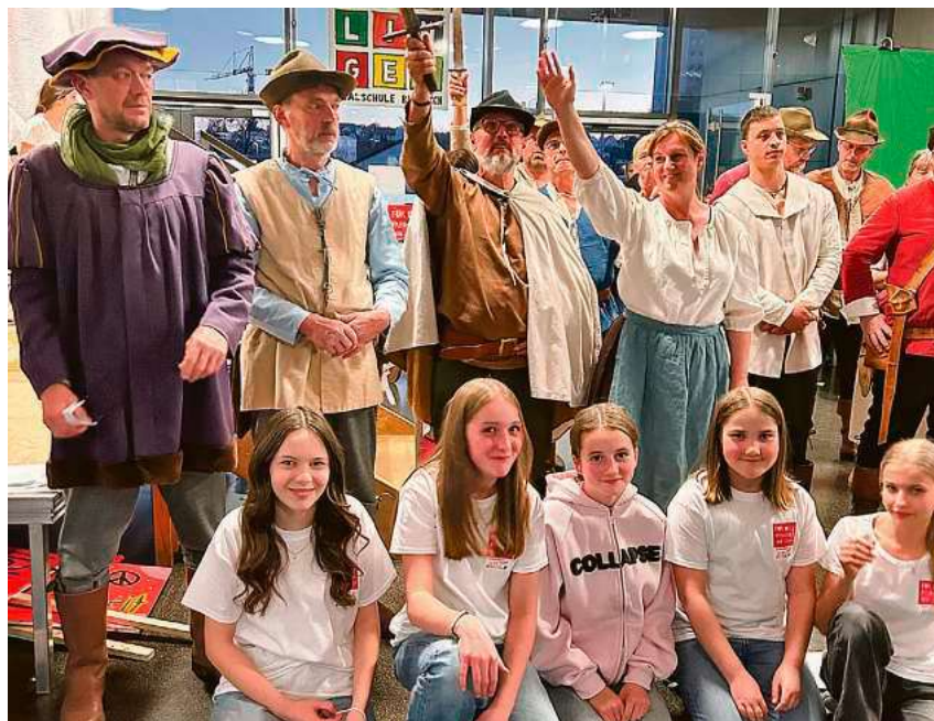
Die Schüler der Dollinger-Realschule lassen die Zeit des Bauernkriegs wieder aufleben.