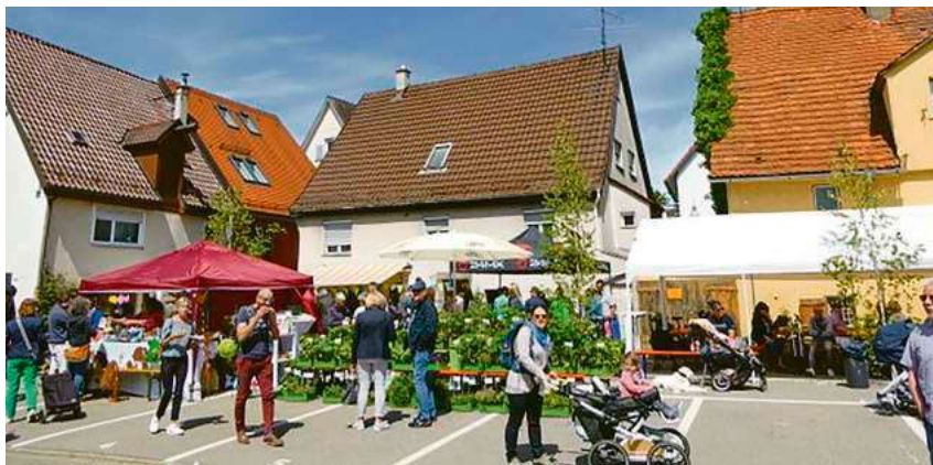
Beim Maimarkt gibt es ein vielfältiges Angebot für Jung und Alt.

Mit der Veranstaltung soll gezeigt werden, dass Quartiere, selbst in der engen Altstadt, lebendig sein können. Auf dem Markt in der Zwingergasse/Neuen Gasse und auf dem AOK-Parkplatz gibt es ein vielfältiges Angebot für Jung und Alt, darunter Seilhüpfen, Kreide malen, Geschicklichkeitsparcours, Seifenblasen und gemeinsames Singen von Kinderliedern mit Begleitung von Geige und Gitarre. Die Kinder können sich zudem auf den Ponys durch die Altstadt kutschieren lassen.