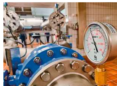
Mit einem Druck von zehn bar wird das Wasser in den Hochbehälter Jordanberg gepumpt.