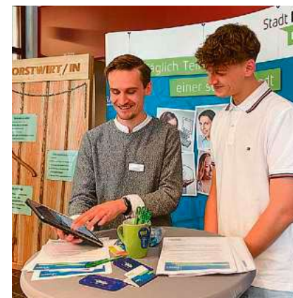
Die Stadtverwaltung Biberach freut sich auf interessante Gespräche.

Unter www.future4you-bc.de finden Besucherinnen und Besucher wie auch Aussteller zahlreiche Informationen rund um die Messe. Auf dem Onlineportal können die Ausstellenden sich selbst und ihre Ausbildungsplätze und Studienangebote über die Livemesse hinaus das ganze Jahr präsentieren. Auch Firmen und Bildungseinrichtungen, die nicht live bei der „future4you“