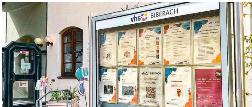
Die vhs sucht für das Herbst- und Wintersemester neue Dozenten.