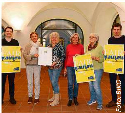
2024 wurde Biberach erneut als „Fairtrade-Stadt“ zertifiziert.