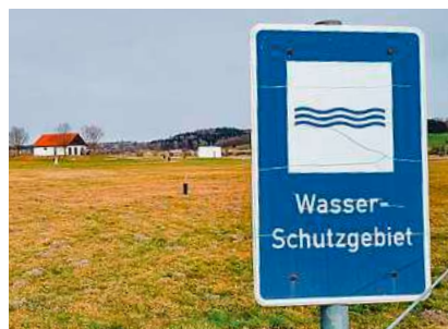
Direkt um das Pumpwerk liegt die Wasserschutzgebietszone 1.

Herzstück des Pumpwerks in Appendorf sind die beiden Brunnen, die in zwei Pumphäusern auf dem Gelände untergebracht sind. Brunnen A, Baujahr 1974, führt 28 Meter in die Tiefe. Brunnen B aus dem Jahr 1985 ist sogar 35 Meter tief. Verbaut ist die identische Technik. 2023 wurden beide Pumpen, die in der Regel nicht zur selben Zeit in Betrieb sind, erneuert. Im Brunnen A werden bis zu 60 Liter Wasser pro Sekunde gefördert, im Brunnen B bis zu 80 Liter pro Sekunde.