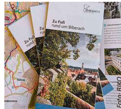
Die Rad- und Wanderbroschüre zeigt verschiedene Wege rund um Biberach.

Aus der UN-Konferenz von 1992 ist die Agenda 21 entstanden. Ein Aktionsprogramm, das sich den Themen Umwelt und nachhaltiger Entwicklung widmet. In Biberach wurde daraufhin im Jahr 2000 die Initiativgruppe der Lokalen Agenda gegründet. Seitdem ist viel passiert – doch die Themen der Lokalen Agenda sind nach wie vor hochaktuell. Im Jahr ihres Jubiläums schaut die Lokale Agenda zurück auf das Erreichte, aber auch nach vorne auf viele weitere Projekte.