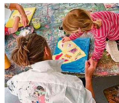
Kreative Momente entstehen im Großeltern-/Kind-Malatelier.

Eine Anmeldung ist montags bis freitags von 8 bis 12.30 Uhr sowie dienstags und mittwochs von 14 bis 16 Uhr