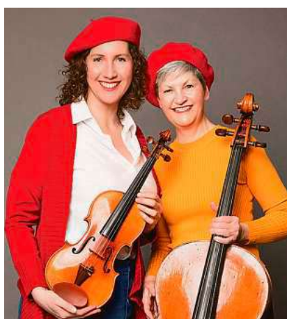
Das Duo Movimento gestaltet am 24. April einen deutsch-französischen Abend.

Der Verein Städte Partner Biberach und das Biberacher Friedensbündnis veranstalten mit Unterstützung durch „Partnerschaft für Demokratie im Landkreis Biberach“ und weiteren Organisationen am Donnerstag, 24. April, um 19.30 Uhr im Gemeindezentrum St. Martin, Kirchplatz 3, ein Konzert zum Gedenken an das Ende des Zweiten Weltkriegs. Der Eintritt ist frei, Spenden sind willkommen.