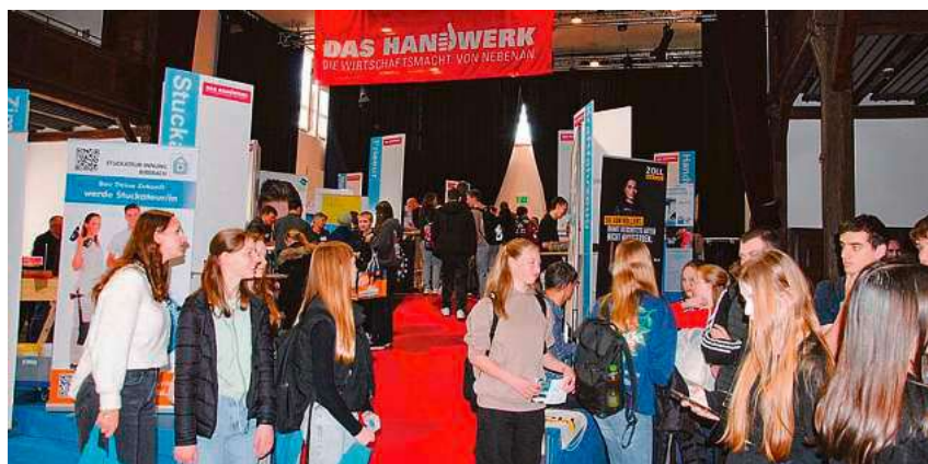
Auf der „future4you“ werden rund 300 verschiedene Ausbildungsberufe und Studiengänge werden präsentiert.

Auf der Messe lassen sich Ausbildungsberufe an mehr als 100 Ständen durch praktisches Ausprobieren erkunden. Rund 300 verschiedene Ausbildungsberufe und Studiengänge werden präsentiert. Neben kaufmännischen Berufen werden auch technische Berufsbilder und handwerkliche Berufe vorgestellt. Mehrere Hochschulen präsentieren ihre verschiedenen Studiengänge. Auch im Außenbereich zur Messe gibt es wieder verschiedene Trucks und Stände. Daneben bieten einige Unternehmen auch duale Studienmöglichkeiten an. Diese finden abwechselnd in Betrieb und Hochschule statt.