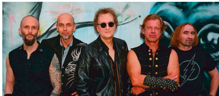
Die Band Tyrant aus Ulm rockt im Abdera mit den Heavy-Metal-Fans.

Tyrant war eine der populärsten frühen Heavy-Metal-Bands in Deutschland und veröffentlichte bis 1990 weltweit insgesamt fünf Alben. Bereits das erste Studioalbum „Mean Machine“ katapultierte die Gruppe in den Heavy-Metal-Charts zwischen Bands wie Metallica, Iron Maiden, Scorpions und Deep Purple. Nach langer Pause feierte die Band 2022/2023 ihr Comeback bei den „Keep It True“-Festivals in Würzburg und Luda-Königshofen. In fast vollständiger Originalbesetzung arbeiten die fünf Musiker aus der Region Ulm aktuell an neuen Songs für ein sechstes Album, das 2025 erscheinen soll.