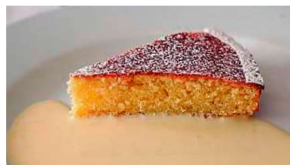
An drei Vormittagen wird gemeinsam in Asti gekocht.

Da die Küche und die Weine neben der Landschaft zu den Höhepunkten im Piemont zählen, in dem Asti liegt, gibt es neben dem Kochen an drei Vormittagen wieder ein buntes Rahmenprogramm, um Asti, seine Umgebung und ein paar der vielen Spezialitäten kennenzulernen: eine Stadtführung durch Asti, Besuche in einer Grappa-Destille-