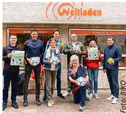
Dank der AG Öffentlichkeitsarbeit kickt der FC Wacker mit fairen Bällen.