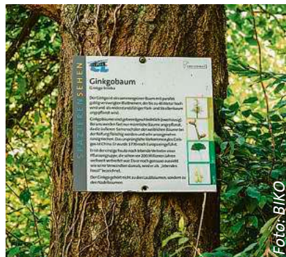
Der von der AG Grün instandgehaltene Naturkundepfad bietet viele Infos.