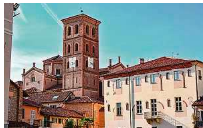
Im Juni geht es mit StäPa wieder nach Asti ins Piemont.

Familien mit Kindern im Alter von zwei bis zehn Jahren sind am Freitag, 9. Mai, von 15 bis 16.30 Uhr zum „Religiösen Familienkreis“ in das Familienzentrum St. Wolfgang eingeladen. Beim gemeinsamen Essen werden christliche Werte