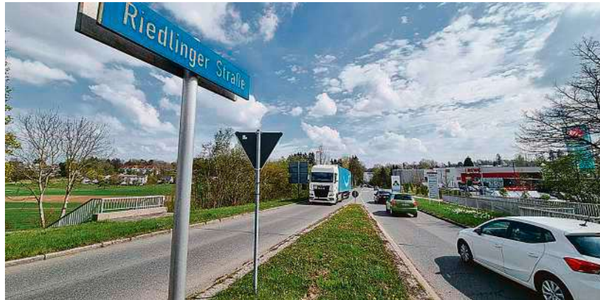
Das Durchfahrtsverbot soll unter anderem die Riedlinger Straße vom Lkw-Verkehr entlasten.

Beschlossen worden war die probeweise Umsetzung des Lkw-Durchfahrtsverbots vom Biberacher Gemeinderat bereits vor zwei Jahren. Insbesondere die Riedlinger Straße, die Kolpingstraße und die Felsengarten Straße sollen durch diese Maßnahme vom Schwerlastverkehr entlastet werden. Verzögert hat sich die Umsetzung des Durchfahrtsverbots aufgrund der Dimension der Sanierung der Riedlinger Straße. Wurde zum Zeitpunkt des Gemeinderatsbeschlusses noch von einem Baustellenzeitraum und damit einer Testphase für das Lkw-Durchfahrtsverbot von neun Monaten ausgegangen, wird in der Riedlinger Straße nun voraussichtlich bis Ende 2027 gebaut. Konkret bedeutet das Durchfahrtsverbot, dass der aus Richtung Ried-