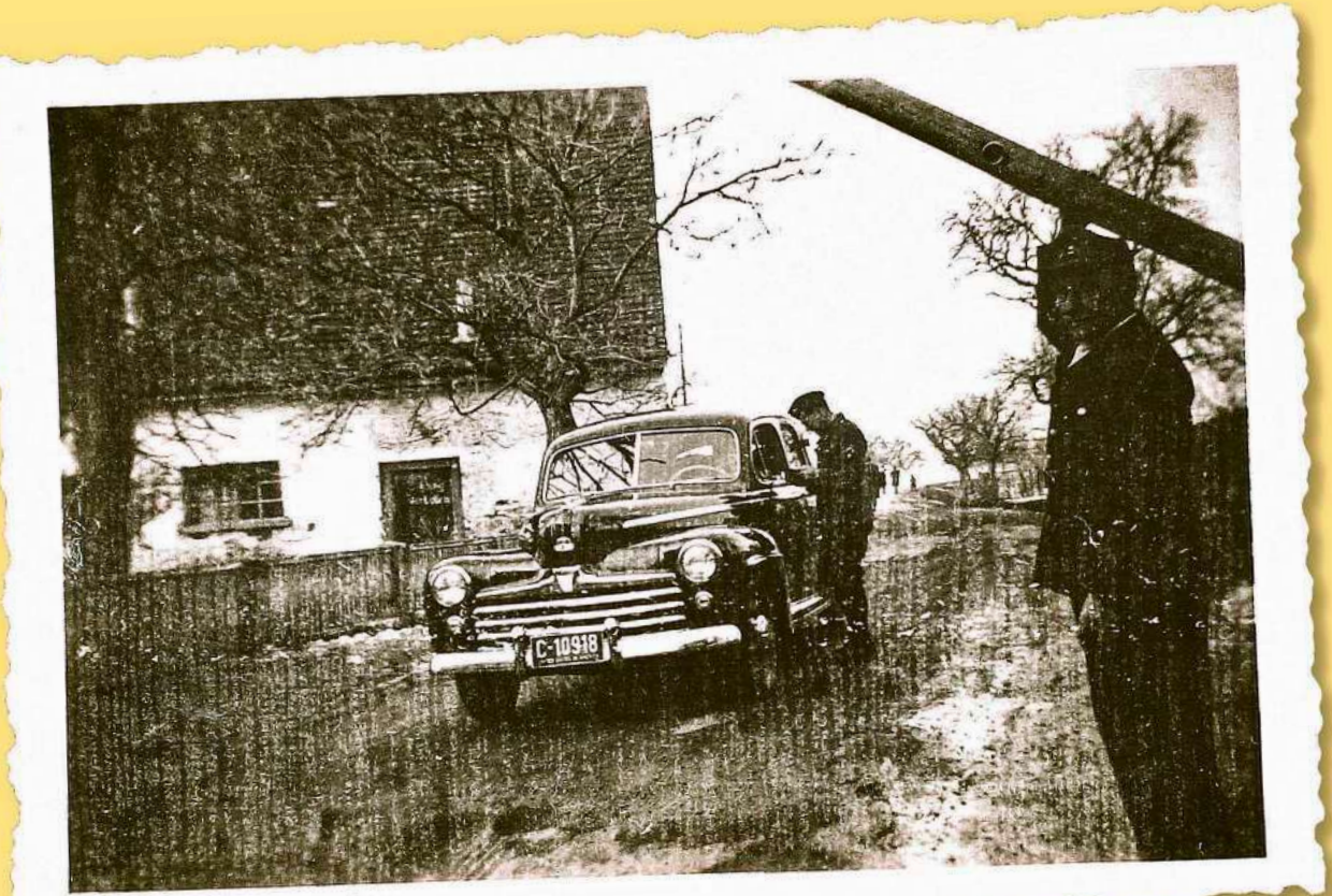
Am Schlagbaum in Achstetten, die Grenze zwischen der französischen und amerikanischen Besatzungszone. (1945–1951)

Am 22. April setzte das I. Korps zur Eroberung Nordoberschwabens an. Eine Gruppe des CC 1 bedrohte nach der Besetzung von Meßkirch, Krauchenwies und Mengen den Verkehrsknotenpunkt Herbertingen, zwei Gruppen des CC 2 zielten nach der Besetzung von Saulgau auf das mittlere Oberschwaben. Noch am Abend eroberten die Franzosen nach kurzem Kampf Kappel bei Buchau. Am 23. April wurde dann zwar der größte Teil des Land-