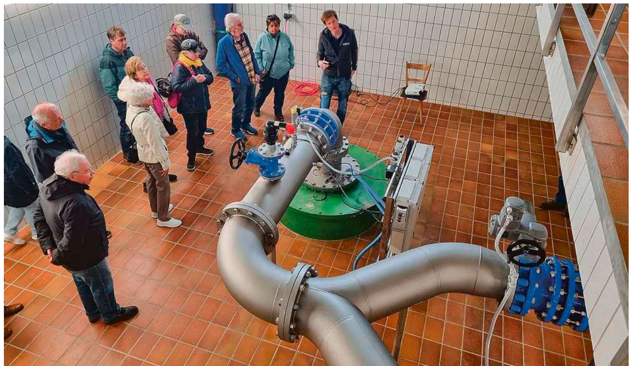
Führung durchs Pumpwerk Appendorf: Brunnen B, der bis zu 80 Liter Wasser pro Sekunde fördert, ist 35 Meter tief.

Barwind betont, dass das hiesige Grundwasser eine sehr gute Qualität habe, natürlich gefiltert durch Erd- und Gesteinsschichten. Für das eingezäunte Wasserschutzgebiet rund um das Appendorfer Pumpwerk gelten strenge Vorschriften, damit keine Verunreinigungen und Schadstoffe ins Trinkwasser gelangen. „Trinkwasser ist ein sehr hohes Gut“, so Barwind. „Engmaschige Kontrollen sorgen dafür, dass es eines der am besten überwachten Lebensmittel in Deutschland ist.“ Einer der zu kontrollierenden Parameter ist Nitrat. Laut Umweltbundesamt wird der Grenzwert von 50 Milligramm pro Liter