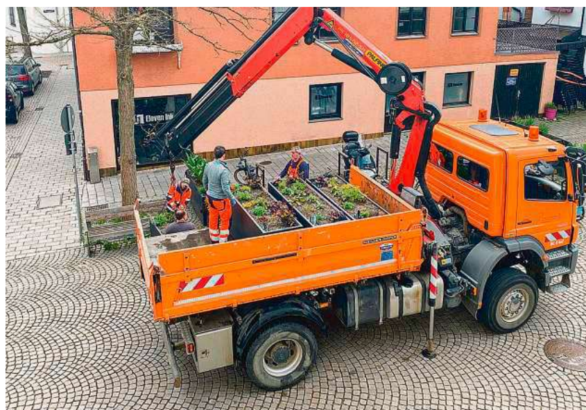
Die Begrünung und Bepflanzung der öffentlichen Flächen geht weiter: In dieser Woche wurden auch auf dem Hafenplatz neu bepflanzte Kübel aufgestellt.