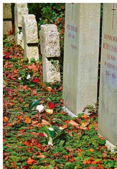
Gräber von im Lager Lindele verstorbenen Deportierten aus Guernsey.

Um 10 Uhr schließt sich ein Gräberbesuch auf dem Evangelischen Friedhof in der Memminger Straße an. Auf dem Friedhof sind befinden sich die Gräber der im Lager Lindele verstorbenen Deportierten aus Guernsey.