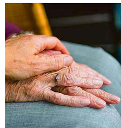
In dem Seminar lernt man, Menschen an deren Lebensende beizustehen.

Das Seminar ist für alle, die in einer sorgenden Gesellschaft Verantwortung übernehmen und zur Verbesserung der allgemeinen Palliativversorgung beitragen möchten. Die Teilnahmegebühr beträgt 25 Euro. Eine Anmeldung bei der vhs ist notwendig.